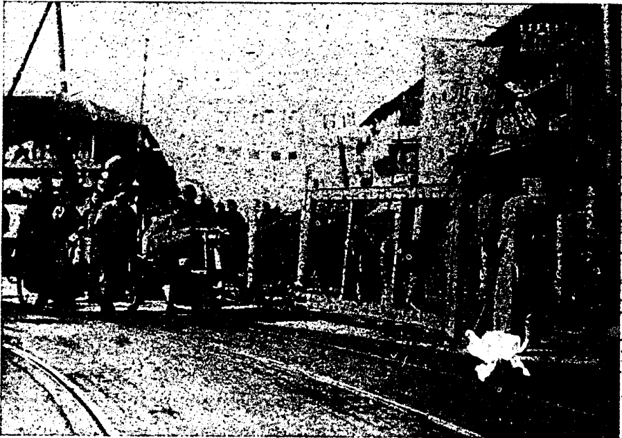
דער אויסלענדישער קווארטאל אין שאנכאי איז אפגעצאמט פון כינעזישן טייל שטאט מיט באריקארעס

לייענען און שרייבן, הויבן אן לייענען צייטונגען און פון דארט דער- זויסן זיי זיך, ווי אזוי אין אנדערע לענדער קעמפן די ארבעטער פאר א בעסערן לעבן. סיי אין אינדיע, סיי אין כינע האבן די ארבעטער זייערע פראפעסיאנעלע פארייגען, וואס פירן א קאמף פאר פאר- קלענערן דעם ארבעטס-מאג, פאר העכערן דעם ארבעטלויזן. אין